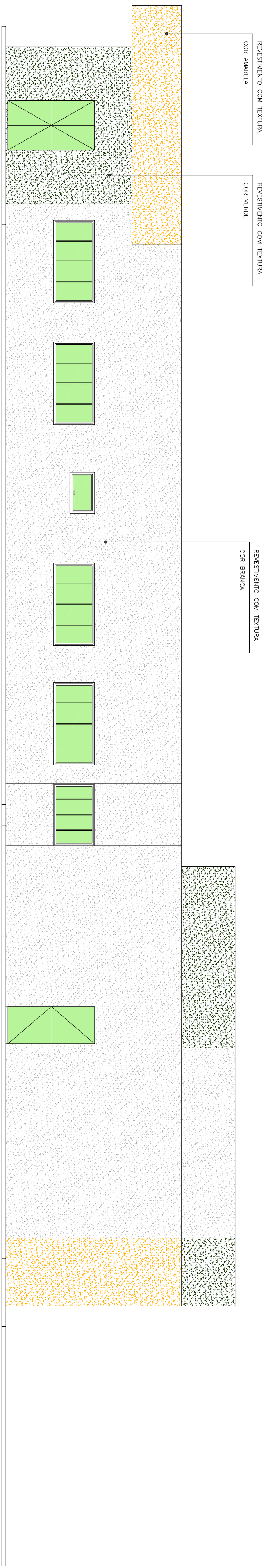
FACHADA DOS FUNDOS ESCALA 1/75